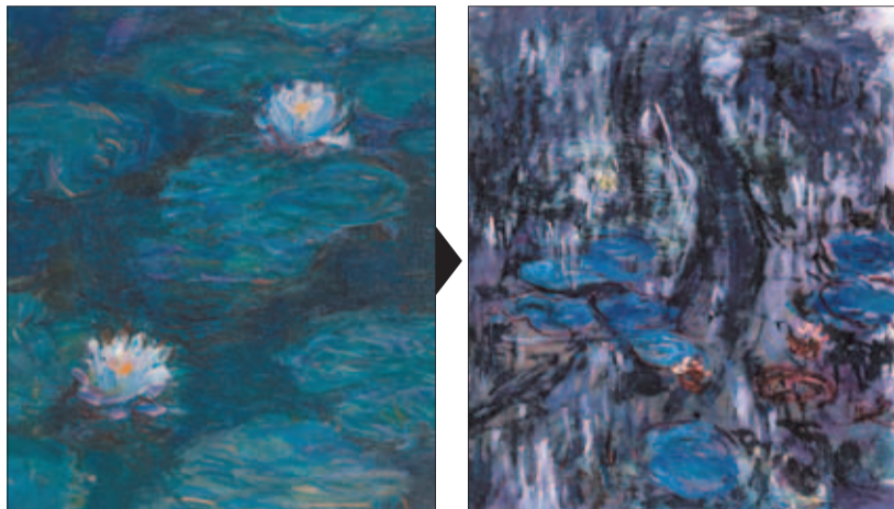
「睡蓮」(1897~98年)部分。鹿児島市立美術館蔵 「睡蓮、柳の反影」(1916~19年)部分。北九州市立美術館蔵 グラフィック：日岩 淳 / The Asahi Shimbun

調査では、40代後半〜50代で老眼を自覚し、メガネをかけたという人が多いことが分かりました。ただ、目の調節能力自体は30代から徐々に低下しているそうです。人生の半分を老眼で過ごす計算ですから、あなごれません。 「老眼を根本的に治すことはできませんが、メガネは、慣れれば使いやすいツール」と本下教授。 老眼用のメガネは、レンズ上方が遠景用、下方が近景・手元用にしているものが一般的です。ほかにも近景・手元用など、何種類